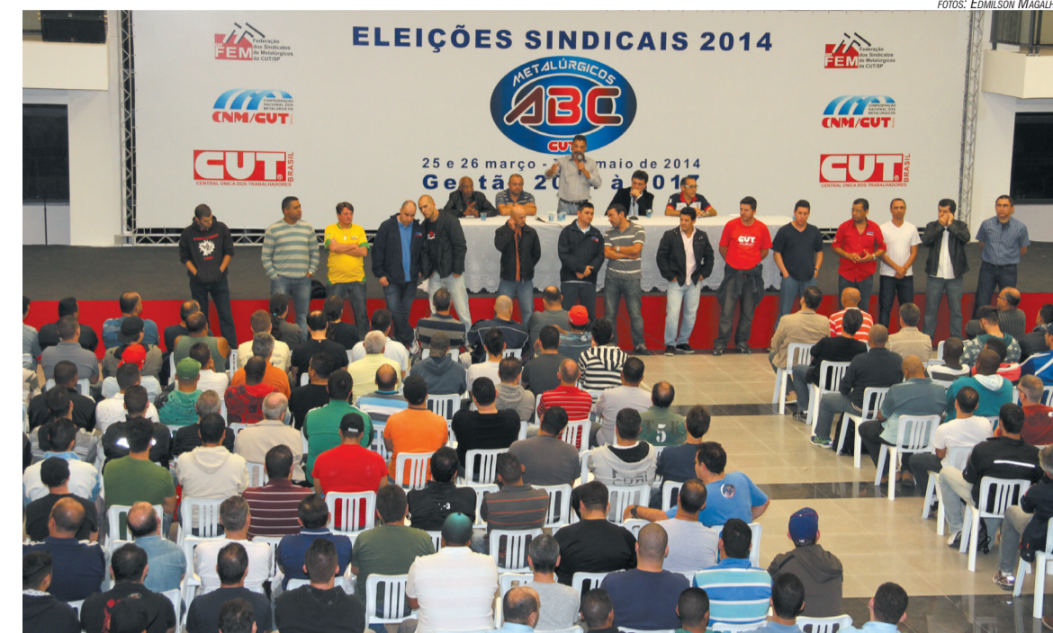
Em convenção realizada na Sede do Sindicato, trabalhadores na Ford aprovam candidatos ao SUR

Para ele, o voto da companheirada é um referendo para as ações da Direção do Sindicato. “Esse apoio é fundamental para garantir nossas